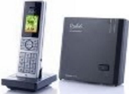
Teléfono móvil con tecnología de protección para el estrés electromagnético.