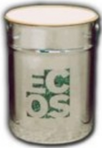
El producto de protección para el estrés electromagnético.