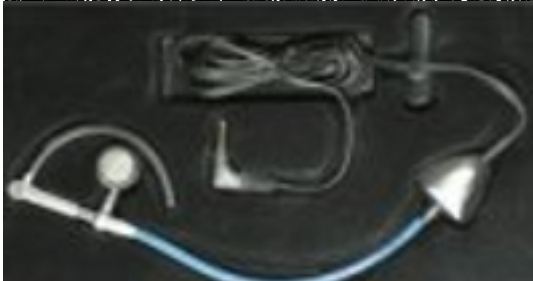
Manos libres para teléfonos móviles que reducen la radiación un