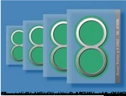
Los productos de protección para el estrés electromagnético.